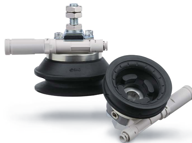
ZHP系列 附真空产生器吸盘