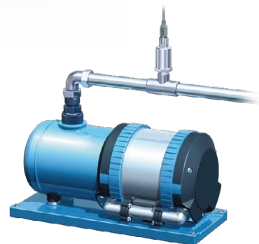
空压机的输出压力控制