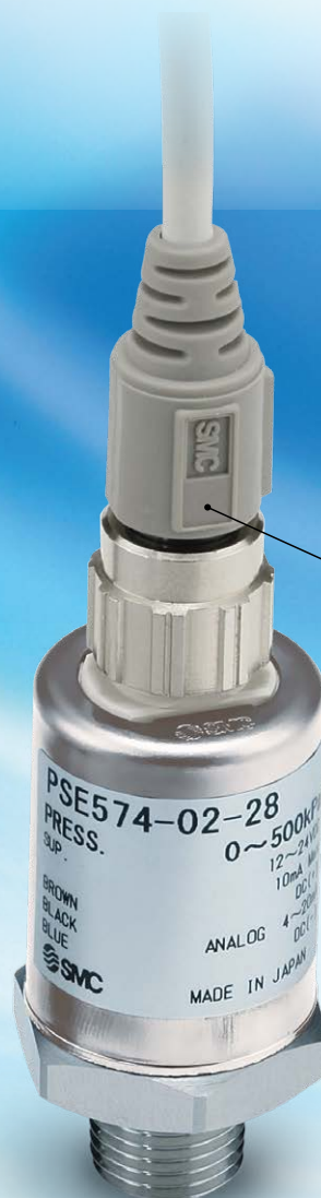
采用 M12 接头