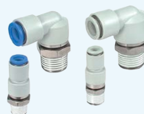
KS + KX 系列