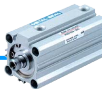
MQQT 薄型低摩擦气缸 基本型