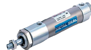
MQML 耐横向负载型低摩擦气缸 基本型