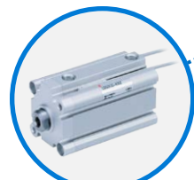
CQ2系列气缸锁定作用