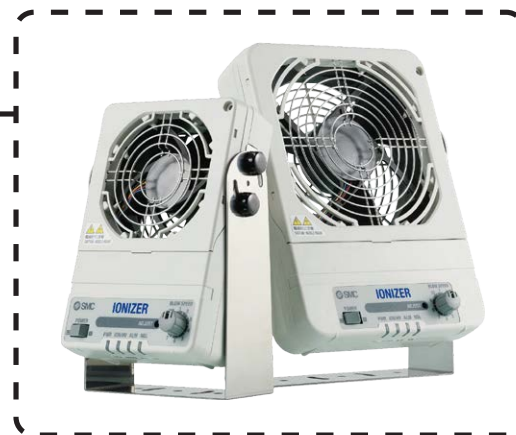
IZF21系列 风扇型除静电器