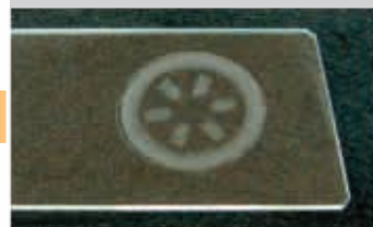
吸盘痕迹非常明显